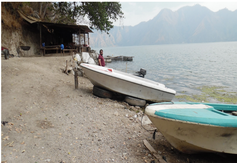
Laguna de Ayarza, Casillas (Santa Rosa).

Por tal motivo no se puede pensar en encontrar allí la pureza étnica de sus pobladores, es decir, que no es posible pensar en hallar a los indígenas de la misma manera en que existieron hace cinco siglos.