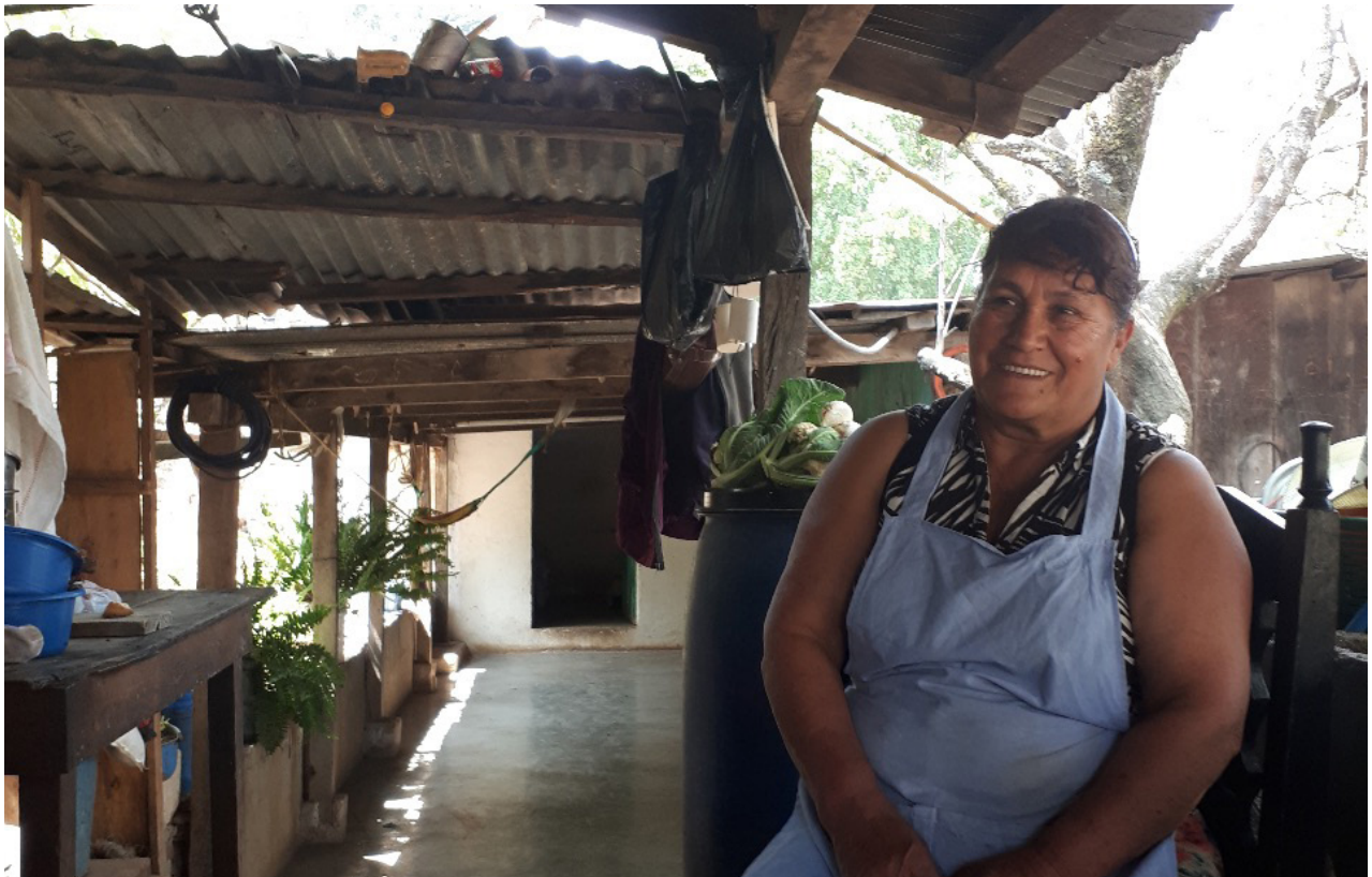
Entrevista con vecina de la aldea El Copante, San Rafael Las Flores.