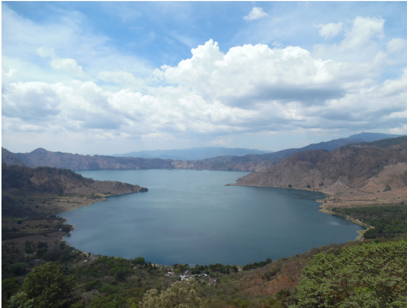
Laguna de Ayarza, Casillas (Santa Rosa).

inversión; la interrupción del empleo para los trabajadores de la mina y de las empresas proveedoras de la misma. Pero la angustia más grande la vivían a diario los pobladores de la aldea La Cuchilla ya que sus humildes viviendas se estaban agrietando debido los trabajos subterráneos inherentes la explotación de minerales. Luego de la decisión de la suspensión temporal de la mina por parte de la CC, esta se tomó más de 300 días para deliberar. En su deliberación fue que entró en juego el IDEI, pero además otras instituciones públicas y privadas. A todo esto, los pobladores en resistencia estuvieron casi ocho meses instalados en carpas, frente a la CC.