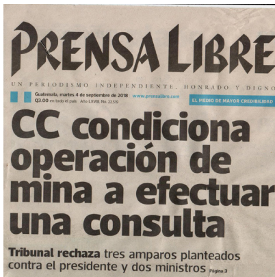
Foto: portada de Prensa Libre del 4 de septiembre de 2018. p.1.