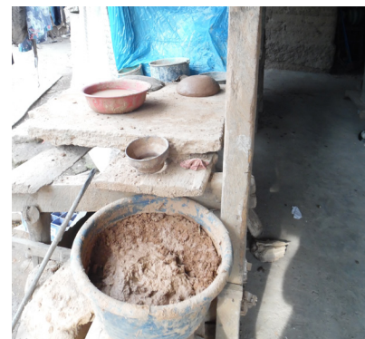
Vivienda de dos mujeres alfareras, quienes elaboran comales y vasijas de barro. Aldea Media Cuesta, San Rafael Las Flores.

El punto nodal en todo esto es qué se debe entender por la consulta y cómo debe efectuarse. Según los magistrados no se trata de un evento de sufragio, sino un diálogo entre las partes, basado en principios de confianza y respeto mutuos; así como promover el entendimiento y el consenso en la toma de decisiones. Queda abierto entonces el dilema de a qué diálogo se puede llegar luego de tantos años de desconfianza entre las partes.