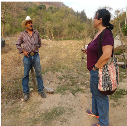
Entrevista con un vecino en el camino hacia la aldea Media Cuesta de San Rafael Las Flores.

En el informe que preparó el IDEI se afirma que el territorio del suroriente de Guatemala y, particularmente de lo que desde mediados del siglo XIX constituye el municipio de San Rafael Las Flores, se ha construido históricamente y por ello se ha ido transformado por distintos procesos políticos, económicos, sociales y culturales.