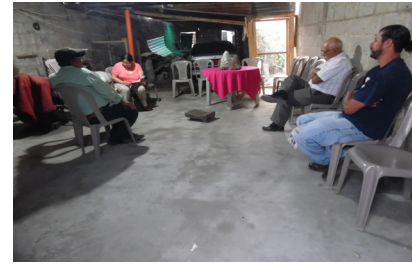
Entrevista colectiva en la cabecera municipal de San Rafael Las Flores.

El estudio del IDEI se entregó a la CC el 4 de abril del mismo año, con lo cual se cumplió con el plazo estipulado que fue de 15 días hábiles. Se trabajó contra reloj para preparar el informe. Afortunadamente ya contábamos con mucha información puesto que se había investigado la caracterización histórico-cultural del suroriente del país desde hacía más de una década. Se contaba también con estudios sobre la Comunidad Indígena de Santa María