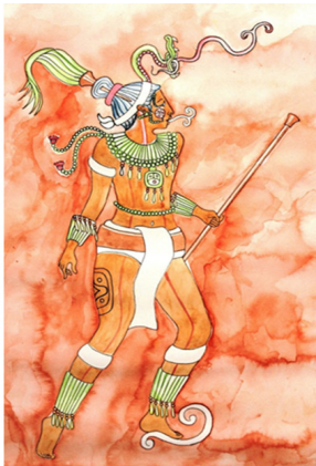
Wuqub' Junajpu ilustración YamaniK Pablo